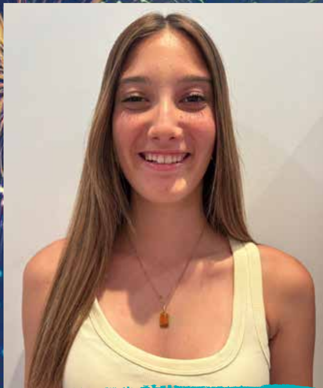
Mireia Torné Solà